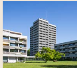
Der Burgerspittel Vierfeldweg 7 | 3012 Bern

T 031 307 66 66 | info@burgerspittel.ch | burgerspittel.ch