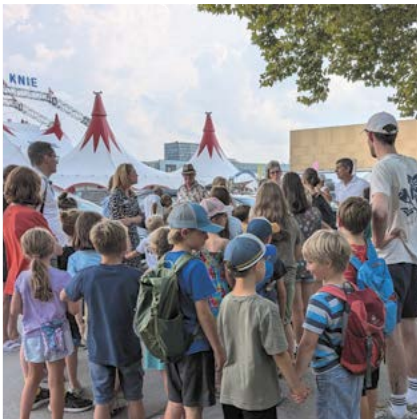
Letzte Anweisungen, bevor wir das Circuszelt betreten

Zu Fuss und mit dem Tram ging's in den Circus Knie. Das Programm war anders als die letzten Jahre, aber auch die poetischen Nummern kamen neben den erwarteten Pferdedarbietungen sehr gut an.