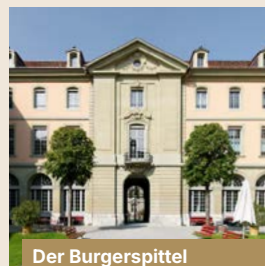
Der Burgerspittel Bahnhofplatz 2 | 3011 Bern