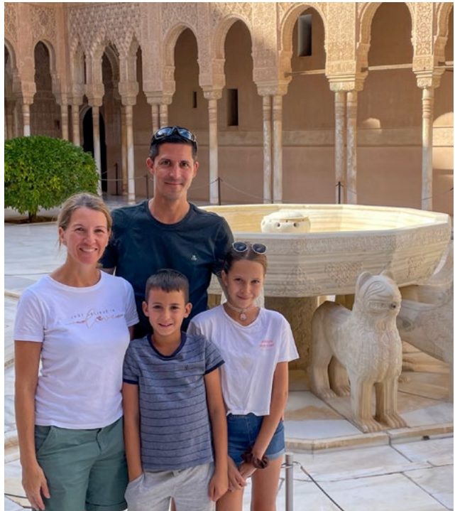
Alhambra Granada, Oktober 2024

In meiner Freizeit sind wir als Familie aktiv unterwegs – dabei spielt der Sport eine wichtige Rolle. Im Winter sind wir gerne in den Bergen auf den Skiern unterwegs und im Sommer trifft man mich häufig auf dem Mountainbike