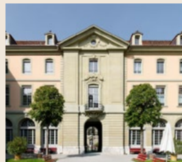
Der Burgerspittel Bahnhofplatz 2 | 3011 Bern