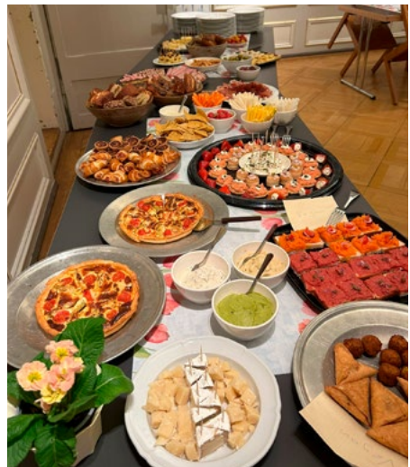
Das - nicht nur zum Anschauen - herrliche Buffet!

Der Anlass endete mit einem feinen Dessert zu Kaffee oder Tee.