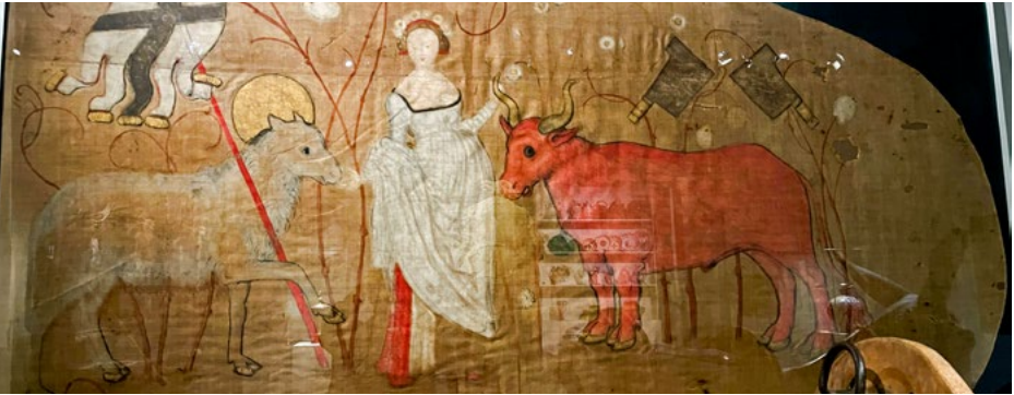
Banner der Zunft zu Metzgern, um 1520